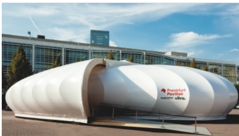
Der Frankfurt Pavilion

Ein Publikumsmagnet war der neue Frankfurt Pavilion, der von Bundespräsident Frank-Walter Steinmeier eröffnet wurde.